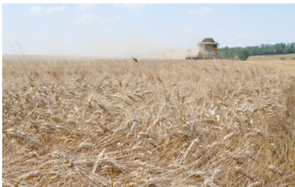
Výsledky tohtoročnej žatvy uspokojili slovenských producentov obilnín, ale aj pestovateľov repky olejnej.

Tento hospodársky rok bol pre poľnohospodárov najextrémnejší z pohľadu priebehu počasia. Od jesene 2020, kedy daždivý september bránil kompletnejmu osevu ozimín, cez pomerne suchú zimu až po mokré leto 2021 s lokálnymi privalovými zrážkami, ktoré spomaľovali žatvu. Pestovateľov nepotešili ani najnovšie odhady Štatistického úradu SR k 15. 9., podľa ktorých bude produkcia zrnovej kukurice nižšia, napriek väčšej osiatej výmere (203 000 ha). Hektárový výnos 7,51, ktorý je nižší ako v minulom roku (8,58 t.ha -1 ), aj ako päťročný priemer úrod kukurice (7,85 t.ha -1 ), dáva predpoklad jej tohtoročnej produkcie na Slovensku v objeme iba 1,5 mil. ton. Ceny sú však zaujímavé aj tu.