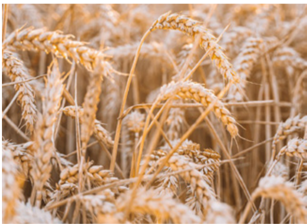
Zvýšenie cien pšenice, kukurice, repky, či sóje vo svete sa odrazilo aj na cenách agrokomodít na Slovensku.

V 9. týždni roka 2021 už mohli držiteľia zásob úrody z roku 2020 na Slovensku predávať pšenicu v elitnej kvalite aj za 200 – 210 eur za tonu. No aj nižšiu, či krmnú kvalitu pšenice predali za prinajmenšom 150 – 170 eur za tonu. Dych vyražala aj cena kukurice, na ktorú dostali výrobcovia ponuky na úrovni až 190 – 220 eur na tonu. V rovnakom období roka 2020 bola cena pšenice na Slovensku okolo 150 – 155 eur za tonu a kukurice cca 135 – 140 eur za tonu (zdroj: obilninar.sk k 21. 2. 2020). Ide teda o výrazný medziročný rozdiel na úrovni 35 – 60 %. V tejto dobe si môžu mädlíť ruky najmä tí podnikatelia, ktorí investovali do vlastných skladovacích kapacít. No zrejme všetci by privítali-