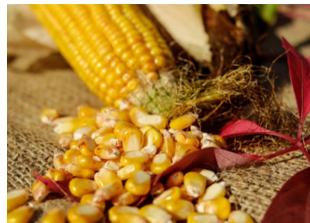
Na kukuricu dostali výrobcovia ponuky na úrovni až 190 – 220 eur na tonu.

U poľnohospodárov dnes budia obavy stále neukončené diskusie o pravidlách budúcej Spoločnej poľnohospodárskej politiky Európskeho spoločenstva. Predovšetkým náročné požiadavky Zelennej dohody EÚ v zmysle zníženia používania umelých hnojív a niektorých pesticídov v najbližších rokoch. Ceny hnojív však v ostatných mesiacoch prudko stúpili, za ostatné dva mesiace aj o 35 až 50 %, podľa druhu. Zmeny klímy a nízka diverzita osevných postupov však spôsobujú čoraz väčšiu tlak škodcov a chorôb. Aj preto asociácie európskych poľnohospodárov navrhujú vynechať hnojivá z nástroja „CBAM“, ktorý chráni hra-