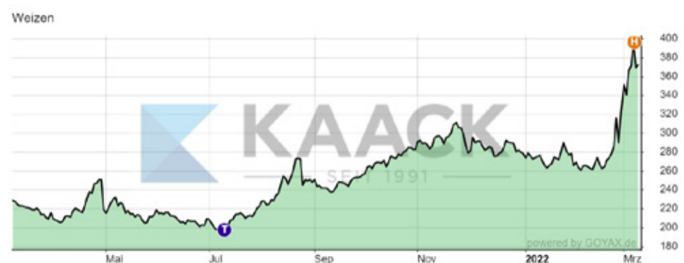
Cena pšenice na burze MATIF [Eur/t].

VLADIMÍRA DEBNÁROVÁ tajomníčka Združenia pestovateľov obilnín